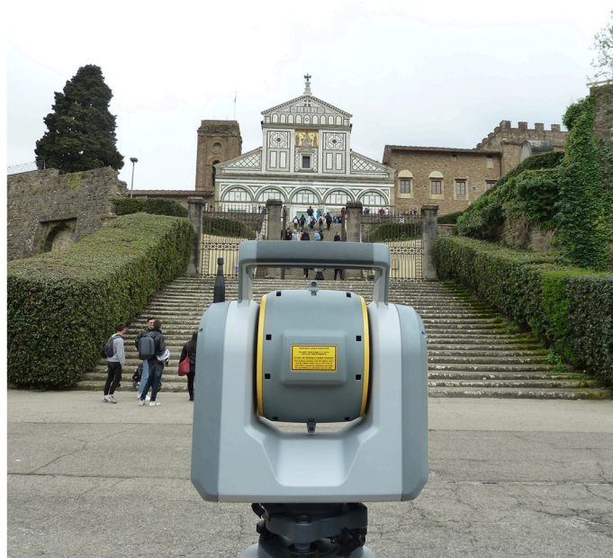
ARCHITETTURA, BENI CULTURALI E PATRIMONIO