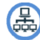
La conferenza "semplificata"

1. La conferenza semplificata (senza riunione) È la modalità ordinaria di svolgimento della conferenza e si tiene senza riunioni in modalità "asincrona", mediante la semplice trasmissione per via telematica tra le amministrazioni partecipanti, delle comunicazioni, delle istanze e della relativa documentazione, degli schemi di atto, degli atti di assenso ecc.