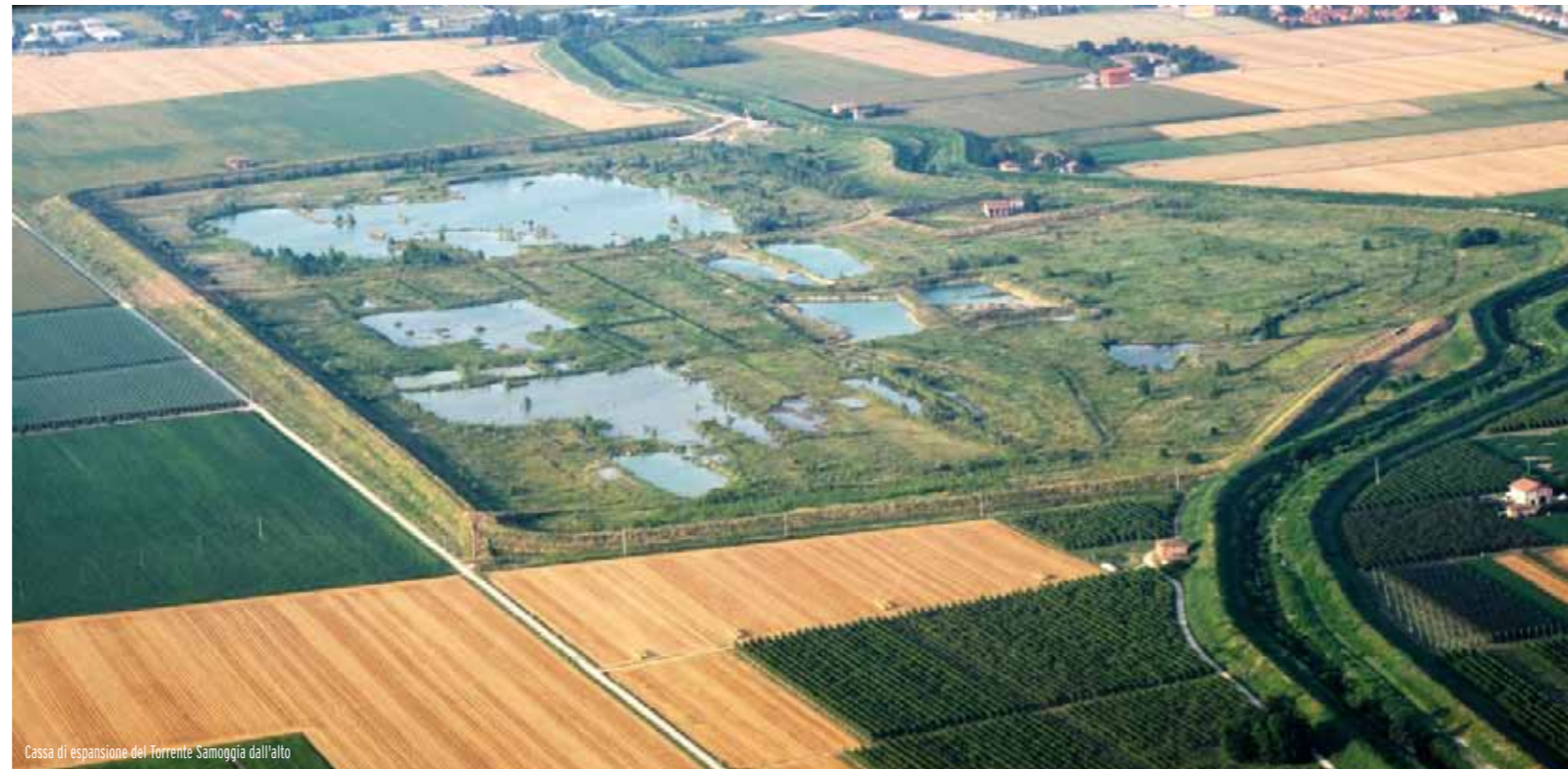
Cassa di espansione del Torrente Samoggia dall'alto

Ai bordi sono state piantumate specie arbustive (nocciolo, prugnolo, viburno, sambuco, rosa canina, sanguinello) che vanno a costituire il mantello periferico del bosco per un totale di 3.880 arbusti.